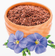
GRAINES DE LIN