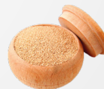
LEVURE DE BIÈRE